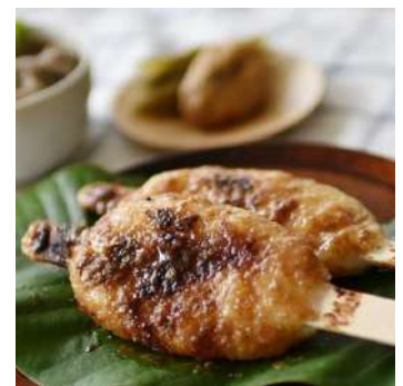
五平餅 米を炊き、半つぶして成形し焼く えごまだれをかけて再度、焼く