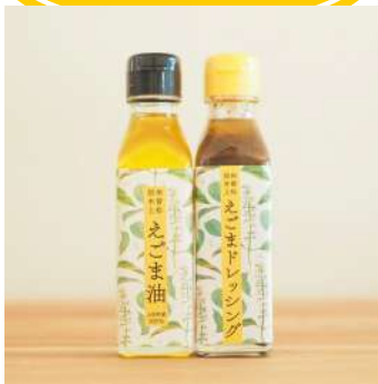
えごま油・ドレッシング 町内産のえごまを低温圧搾