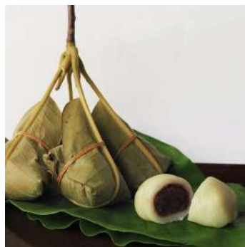
ほお葉巻 米粉を練って小豆あんを中に入れ 朴の葉で包み蒸し上げます