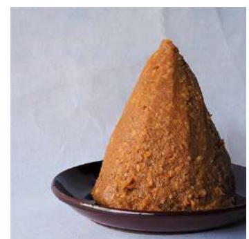
信州味噌 上松町特産品開発センターで手作り