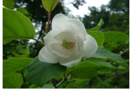
町花：オオヤマレンゲ