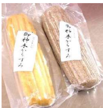
からすみ 米粉で作った蒸し菓子