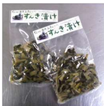
すんき漬け 赤カブの葉を無塩乳酸発酵した漬物