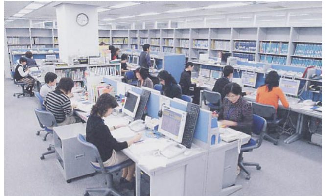
センター内の様子