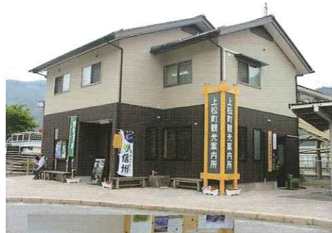
上松駅前 観光情報センター待合所