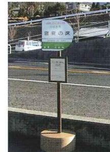
地域公共交通活性化・再生総合事業 バス停整備