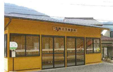
地域公共交通活性化・再生総合事業 立町バス待合所整備